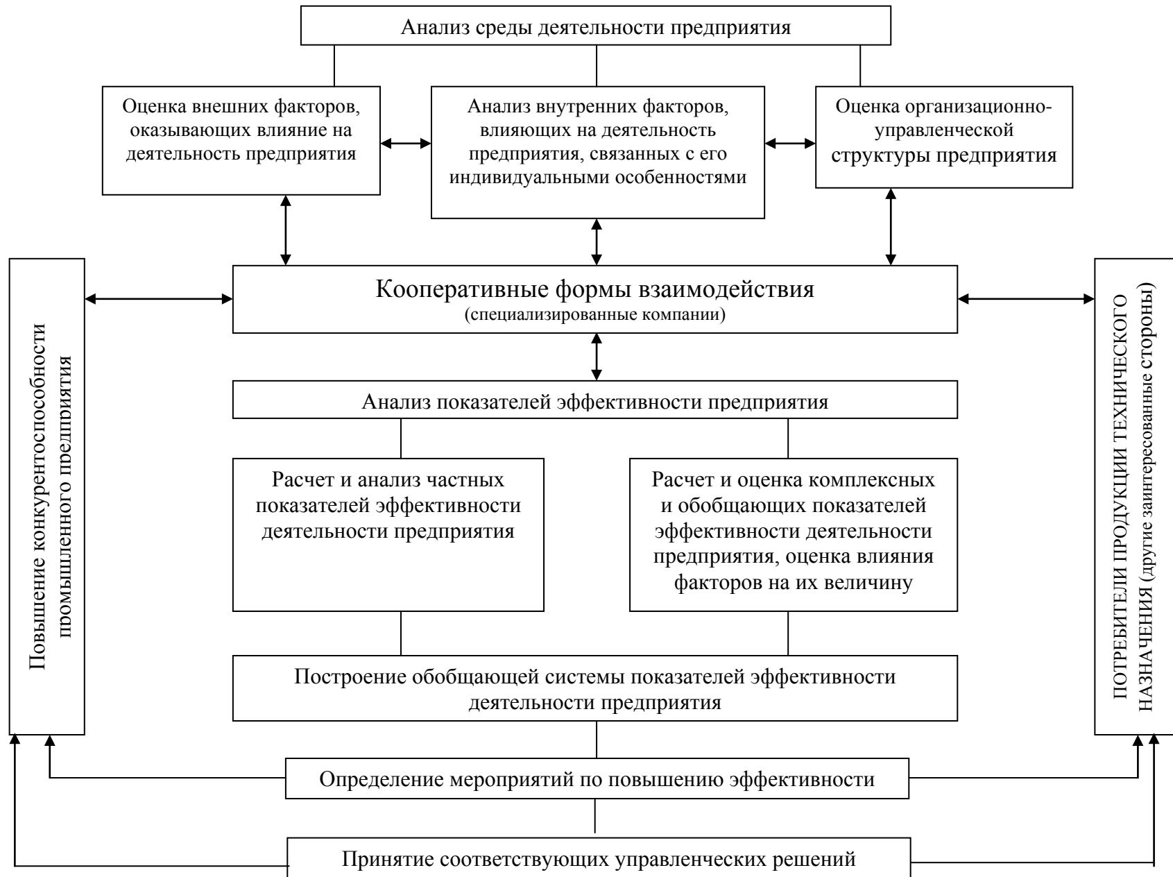
Рис. 3. Механизм управления эффективностью промышленного предприятия с использованием кооперативных форм взаимодействия